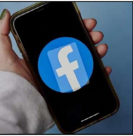
एकमेकांना घराचा पत्ता देत चकरा मारून प्रेमात वेडा सांग करून बलात्कार विनयभंग करत खून करणं यापरीत मजल मारत असतात, मुलीचा मोबाईल क्रमांक मिळविल्यानंतर भेटी घेणे