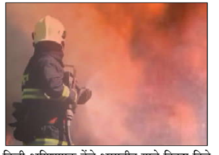
किती अग्निशमन केंद्रे असावीत याचे निकष दिले आहेत. त्यानुसार शहराच्या पहिल्या एक लाख लोकसंख्येसाठी एक, तर त्यापुढील प्रत्येक ५० हजार लोकसंख्येसाठी एक केंद्र असावे. तर दुसऱ्या निकषानुसार १० किलोमीटरच्या हद्दीत एक केंद्र असे नमुद आहे. दाट लोकवस्तीत २० टक्के केंद्रांची वाढ आणि धोका असलेल्या भागात आणखी काही केंद्रे उभारण्याची निकष आहे. त्यामुळे वाढत्या लोकसंख्येच्या निकषानुसार व नागरिकांच्या सोयीसाठी महापालिकेला आणखी किमान २१ केंद्रे उभारवावी लागणार आहेत.

शहराचा विस्तार दिवसेंदिवस वाढत असून उंच इमारती उभ्या राहत आहेत. त्या तुलनेत महापालिकेच्या अग्निशमन विभागाकडे आग आटोक्यात आणण्यासाठी अपुरी साधने व मनुष्यबळाचा अभाव आहे. केंद्र सरकारच्या स्थायी अग्निशमन सल्लागार समितीच्या नियमानुसार २६ अग्निशमन केंद्रांची गरज असताना पाच प्रत्यक्षात पाच केंद्रे अस्तित्वात आहेत. त्यामुळे एका अग्निशमन केंद्रावर अडीच लाख लोकसंख्येचा भार आहे. शहरात आगीच्या घटना, भिंत पडणे यासह विविध दुर्घटना घडल्यानंतर पहिला कॉल अग्निशमन दलाला केला जातो. महापालिकेच्या अग्निशमन दलाच्या केंद्रांची संख्या केवळ पाच आहे. केंद्र सरकारच्या स्थायी अग्निशमन सल्लागार समितीच्या नियमानुसार शहराची लोकसंख्या आणि हद्दीनुसार