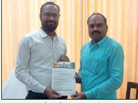
तपासणी व सखोल चौकशी सुरक्षा संच पुरवण्यासाठी लाभाध्यांची गाव निहाय यादी व विविध नमुन्यातील मागणी केलेल्या सर्व कागदपत्राची चौकशी, मधिल कौशल्य वृद्धीकरण योजनेअंतर्गत लाभ घेतलेल्या लाभाध्यांची गावनिहाय यादीसह व विविध नमुन्यात मागणी केलेल्या प्रमाणपत्राची सखोल चौकशी वरील

प्रमाणपत्राची सखोल चौकशी तपासणी व (दसर) तपासणी करून कारवाई करण्यात यावी व केलेल्या कारवाईचा अहवाल समर्थित अधिकारी याच नाव व पदनाम सहित तयार करून वरिष्ठां कडे पाठविण्यात यावा २०१८ ते २०२३ लाभाध्यांची कामगार नॉंदणी केलेल्या ग्रामपंचायतीच्या रेकॉर्डवरील ग्रामसेवक यांनी दिलेल्या प्रमाणपत्राची सखोल चौकशी विवाहाच्या खर्चाच्या प्रतिकृतीसाठी लाभ घेतलेल्या सर्व लाभाध्यांचे प्रथम विवाह नॉंदणी प्रमाणपत्र व प्रथम विवाह असल्याचे शपथपत्रासह दिलेल्या सर्व कागदपत्राची सखोल चौकशी मधिल ग्रामपंचायत रेकॉर्ड नॉंदणीप्रमाणे व कॉन्ट्रॅक्टद्वारे प्रमाणित केलेल्या ९० दिवस कामावर असलेल्या प्रमाणपत्रासहित सखोल चौकशी मधिल अति आवश्यक संच पुरवण्यासाठी विविध नमुन्यातील मागणी केलेल्या सर्व कागदपत्रासहित