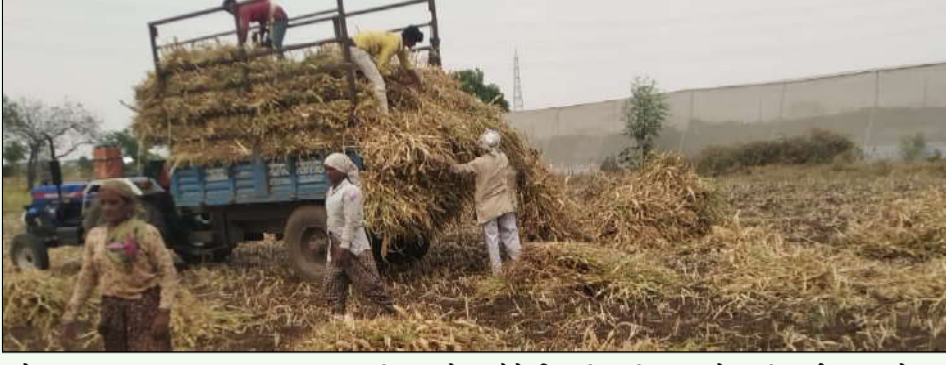
पोषक चारा म्हणून कडव्याला मागणी असते. पैसे मिळतील ही अशा शेतकरी वर्गाला असते तर कडव्याच्या पैशातून पुढील पीक घेण्यासाठी दोन

भोकरदन तालुक्यातील वाढत्या महागाईचा झळ शेतकऱ्यांना बसत आहे. जनावरांना लागणारा चारा आता महागला असून पशुधन जगवण्याचे आवहन शेतकऱ्यांसमोर असताना कडव्याचा भाव प्रति शेकडा २५०० ते ३००० हजार रुपये असा झाल्याने बळीराजा हवालदिल झाला आहे. ज्वारीचा पेरा कमी झाल्याने चारा उपलब्ध होत नसून कडव्याचे भाव वधारल्याने शेतकरी त्रस्त झाले आहेत. अनेक शेतकरी दुसऱ्या गावातून मिळेल त्या भावात चारा खरेदी करीत असल्याचे चित्र ग्रामीण भागात दिसत आहे. जनावरांना