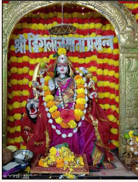
मायेचं छत्र तर दिलेच त्याचबरोबर त्यांच्या प्राणांचे रक्षणही केले.

नुसार शिवपत्नी पार्वती/ दक्षराजाची कन्या सती हीच अंबिका आहे. अशा प्रकारे हिंगुल+अंबिका या शब्दांच्या एकत्रीकरणाने हिंगुलांबिका या शब्दाची उत्पत्ती झाली. भक्तांच्या हाकेला धावणारी सध्या हे ठिकाण पाकिस्तानात असून हिंदू धर्म ग्रंथ आणि संतांच्या कथेनुसार येथे विष्णूचे अवतार परशुरामांचे वडील जमदग्नि यांनी घोर तपस्या केली होती. भगवान परशुरामाच्या २१ वेळा पृथ्वी निःक्षत्रिय करण्याच्या प्रतिज्ञेमुळे अनेक क्षत्रिय हिंगलाज देवीच्या आश्रयाला गेले. देवीने त्यांना ब्रम्हक्षत्रियत्व देऊन त्यांचे रक्षण केले. अनेक क्षत्रिय या देवीच्या आश्रयाने आपला व्यवसाय बदलून राहत होते. वेगवेगळे व्यवसाय करून जगत होते. ज्या देवीच्या आश्रिवादाने ते क्षत्रिय जिवंत राहिले ती देवी त्यांची कुलदेवता बनली. ब्रम्हवैवर्तपुराणानुसार बलुचिस्तानातील हिंगलाजमातेचे दर्शन केल्यास त्याला पूर्वजन्माच्या कर्माचे दंड मिळत नाही. प्रभू रामचंद्रसुद्धा रावणाचा वध केल्यानंतर ब्रम्हण हत्येपासून मुक्ती मिळविण्यासाठी देवीच्या दर्शनासाठी आले होते. व त्यांनी एक यज्ञही केला होता. त्याचबरोबर आध्यात्मिक संत गुरु नानक, दादा मखान, गोरखनाथ व भारताचे माजी पंतप्रधान स्वर्गीय राजीव गांधी