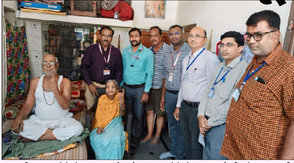
असून महिला मतदारांची संख्या ३३८ आहे. तसेच दिव्यांग (झथळ) मतदारांची एकूण संख्या ८९ आहे, यामध्ये पुरुष मतदारांची संख्या ६२ असून महिला