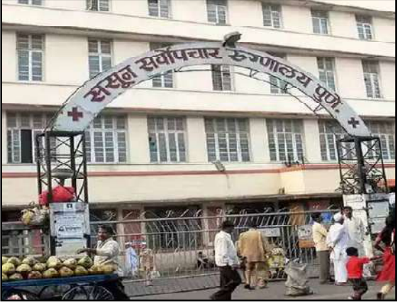
लोकनेता न्युज नेटवर्क