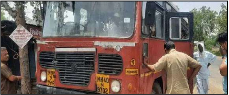
आरडाओरडा करत आकांडतांडव केले.

मोबाईल चोरीला गेल्याने एसटीत चढलेल्या तरुणीने आकांडतांडव केले. त्यामुळे धावती बस पोलिस ठाण्यात वळती करण्यात आली. त्याठिकाणी पोलिसांच्या झाडाझडतीने असंख्य प्रवाशांना मनस्ताप सहन करावा लागल्याची घटना शनिवारी सकाळी घडली. याशिवाय तब्बल पाऊण तास एसटीचा खोळंबा झाल्याने एकच खळबळ उडाली.