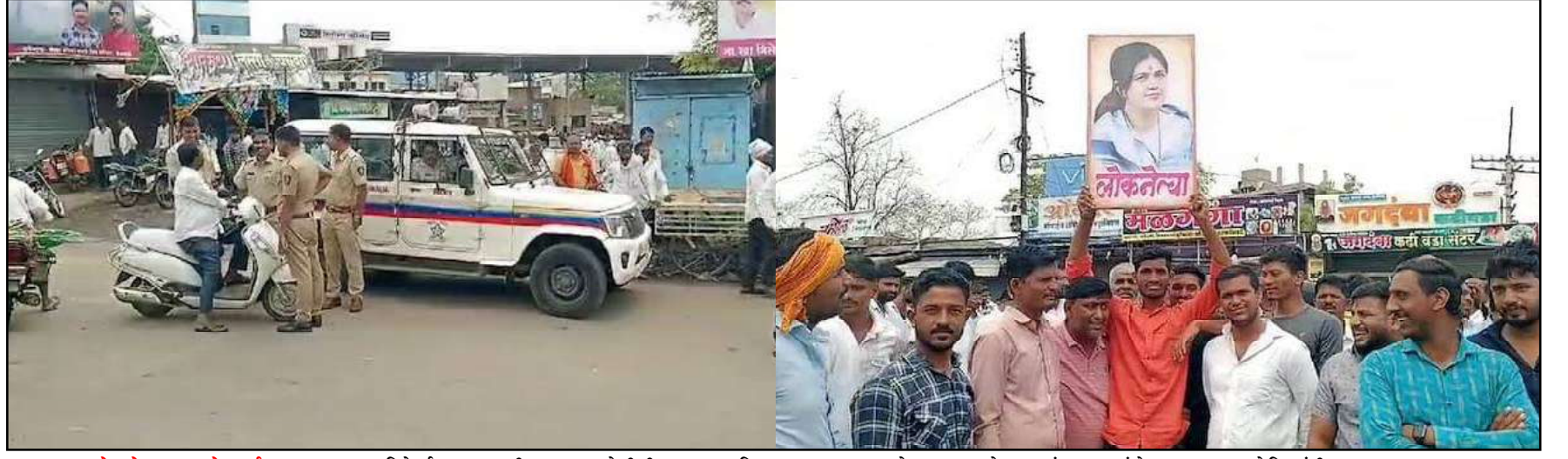
लोकनेता न्यूज नेटवर्क अहिल्यानगर | प्रतिनिधी

भाजप नेत्या पंकजा मुंडे यांच्याबाबत समाज माध्यमात आक्षेपार्ह स्टेटस ठेवल्यावरून अहमदनगरच्या पाथर्डी तालुक्यातील शिरापूर येथे तणाव निर्माण झाला होता. या प्रकाराच्या