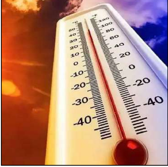
लोकनेता न्यूज नेटवर्क

राजधानी दिल्ली आणि आसपासचा परिसर सध्या वाढत्या उष्णाने होरपळतो आहे. सारे लोकजीवन स्तब्ध करणारा इतका तडाखा का बसतो आहे, याचा खोलात जाऊन विचार करायला हवा.