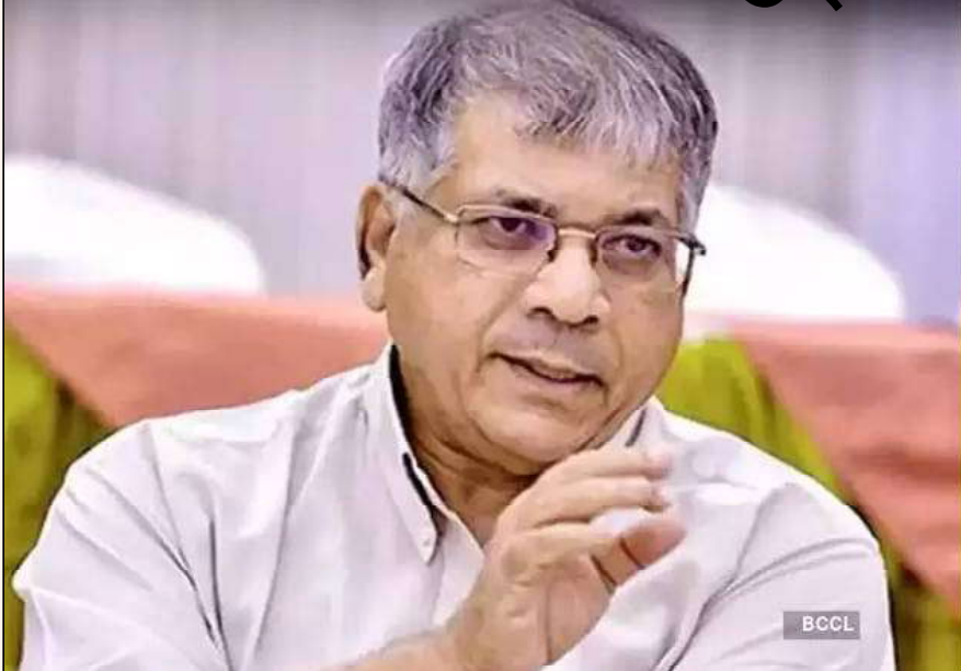
आघाडीचा उमेदवार निवडून येणार नसेल तरी स्वाभिमानाने जगण्यासाठी वंचितलाच मतदान करा.

२०१९ च्या लोकसभा निवडणुकीत अकोला व सोलपूर मतदारसंघात स्वता उभे राहून एकाही ठिकाणी ते निवडून आले नाही.महा विकास आघाडीचे अनेक उमेदवार पाडले.यांची इतिहासात नोंद झाली.इतिहास वाचला की इतिहास घडविता येतो असे सांगतात. पण आपण इतिहासातून कोणताही धडा घेतला नाही.कारण प्रकाश आंबेडकर यांच्याकडे खासदारकी पदापेक्षा आंबेडकरांचा नातू हे पद मोठे आहे. समाजात कुठे ही गेला तर या नातू पदाला योग्य मान सन्मान मिळणार आहेच.पण समाजाकडे असे काही नाही.ग्रामीण भागातील असंघटित शेतमजुरांना आणि शहरातील सुशिक्षित ठिकाणी राहून सुशिक्षित नोकरी करणाऱ्यांना व इतर सर्वसामान्य जनतेला हेच वाटत होते की,प्रकाश आंबेडकरांनी महाविकास आघाडीत सामिल व्हायला हवे होते.परंतु प्रकाश आंबेडकरांच्या वेगळे लढण्याच्या भुमिकेने वारंवार हे चित्र पहायला मिळते आहे. मोठ्या मोठ्या पक्षालाही आघाडी युती करण्याची गरज वाटते,मग प्रकाश आंबेडकरांना अशी आघाडी का नको असते.आज प्रकाश आंबेडकरांची वंचित मविआचे सोबत असती तर वंचितचे किमान २ तरी उमेदवार निवडून आले असते.महाविकास आघाडीची संख्या वाढली असती. प्रकाश आंबेडकरांच्या वंचितने कोणाशीही आघाडी न केल्यामुळे त्यांचा पण पराभवा झाल्याची नोंद इतिहासात झाली.जागरूक समाजाने ही प्रकाश आंबेडकर यांच्या भूमिकेला पाठिंबा दिला नाही.हे सत्य चित्र समोर आले आहे. येणाऱ्या विधानसभेच्या निवडणुकीत कोणीच उमेदवार वंचित बहुजन आघाडीची उमेदवारी घेणार नाही. पंतु भाजपा काँग्रेस राष्ट्रवादी शिवसेना जैसे देऊन डमी उमेदवार पुरविण्याचे काम शंभर टक्के करेल.आणि बहुजन