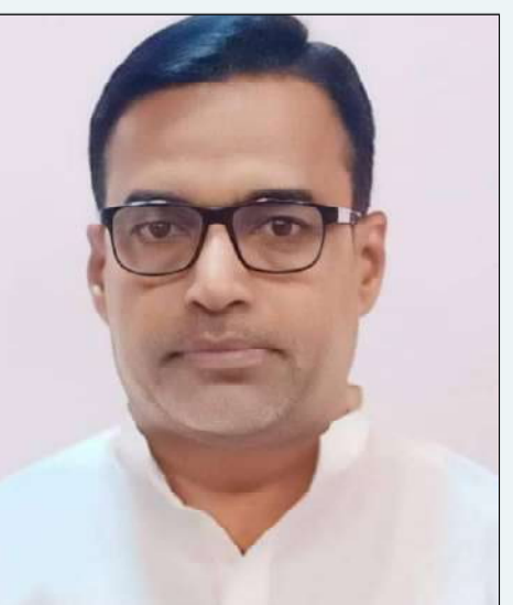
शिक्षकांनी विद्यार्थ्यांना मार्गदर्शन करून चांगले नागरिक घडवण्याचे काम करावे असे आवाहन केले. या