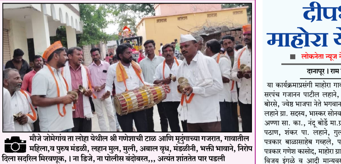
मौजे जोमेगांव ता लोहा येथील श्री गणेशाची टाळ आणि मृदंगाच्या गजरत, गावातील महिला, व पुरुष मंडळी, लहान मुल, मुली, अबाल वृध, मंडळीनी, भक्ती भावाने, निरोप दिला सदरिल मिरवणूक, । ना डिजे, ना पोलीस बंदोबस्त,, अत्यंत शांततेत पार पडली