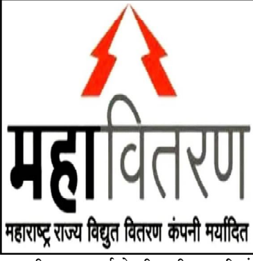
महाराष्ट्र राज्य विद्युत वितरण कंपनी मर्यादित

केली असल्याचे उघड झाले होते म्हणून त्या एजन्सीला कायम काळ्या यादीत टाकून ज्या कोणी संबंधित अधिकारी या मध्ये शामिल असल्यास निलंबनाची कारवाई करावी अशी तक्रार ३१ /८/ २०२४ रोजी विभागीय कार्यलयात आणि परळी कार्यलयात केली असून तक्रार करून वीस दिवस उलटून गेले आहेत मात्र कोणत्याही कार्यलयाचे कसलीही कारवाई केली नसल्याने परळीत वीज ग्राहक आणि तक्रारदार यांनी स्थानिक अधिकारी सगणमंत आहे का अशी चर्चा करत आहेत तेव्हा आठ दिवसांत या