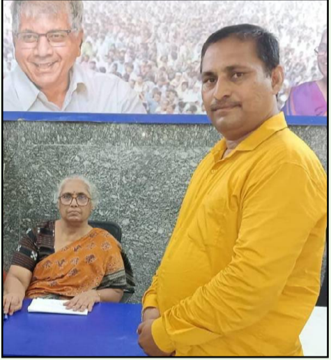
वंचित बहुजन आघाडी पक्ष जो निर्णय घेईल तो माला मान्य आहे,असे त्यांनी सांगितले ज्यावेळी पक्षाने जो